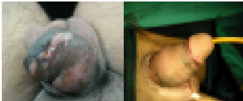
ภาพอวัยวะเพศก่อนและหลังผ่าตัดหุ้มด้วยหนังอัมตะ

การฉีดสารแปลกปลอมเข้าอวัยวะเพศนอกจากจะไม่สามารถขยายขนาดได้ถาวรแล้ว ยังทำให้มีปัญหาต่างๆ ตามมาอีกมากมาย ในระยะแรกของการฉีด มีความเสี่ยงที่จะติดเชื้อ เป็นหนองหรือติดเชื้อไวรัสอันตรายหลายชนิด เช่น เอดส์ ด้บอักเสบจากการฉีดโดยอุปกรณ์ที่ไม่สะอาด สารที่ฉีดอาจไหลไปตามแรงโน้มถ่วงของโลกเข้าสู่บริเวณต่างๆ เช่น อัมตะ หัวหน่าว เป็นต้น ในระยะต่อไปก็จะเกิดปัญหาเป็นก้อนคั่งรังหรือเป็นแผลเรื้อรังดังที่กล่าวมาแล้ว และอาจกลายเป็นมะเร็งของอวัยวะเพศได้ การรักษาทำได้ยากและต้องการแพทย์ผู้เชี่ยวชาญ ดังนั้นควรทราบว่า การฉีดสารแปลกปลอมเข้าอวัยวะเพศจะมีปัญหาตามมามากมาย และแก้ไขให้กลับไปเหมือนเดิมไม่ได้ จึงไม่ควรหลงเชื่อบุคคลต่างๆ ในการที่จะฉีดสารแปลกปลอมใดๆ เพื่อขยายขนาดอวัยวะเพศ