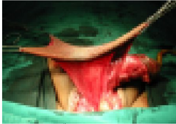
ผิวหนังอัมตะพร้อมเส้นเลือดที่มาเลี้ยงที่นำไปคลุมอวัยวะเพศที่ตัดหนังที่เป็นโรคออกแล้ว