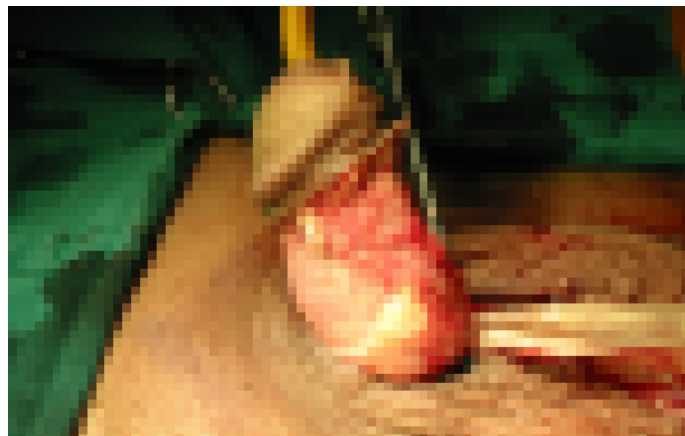
อวัยวะเพศที่ผ่าตัดเอาสารแปลกปลอมและผิวหนังที่ปกคลุมออกแล้ว

อวัยวะเพศที่ได้รับการฉีดสารแปลกปลอมมาแล้ว ไม่สามารถรักษาให้เหมือนเดิมได้ แต่รักษาให้ดีขึ้น แก้ปัญหา ก้อนแข็ง การคิงรั้งตลอดจนแผลเรื้อรังได้ โดยการตัดสารแปลกปลอมและผิวหนังของอวัยวะเพศที่ปกคลุมออก แล้วปิดแผลด้วยผิวหนังจากถุงอัมตะหรือปลูกผิวหนัง