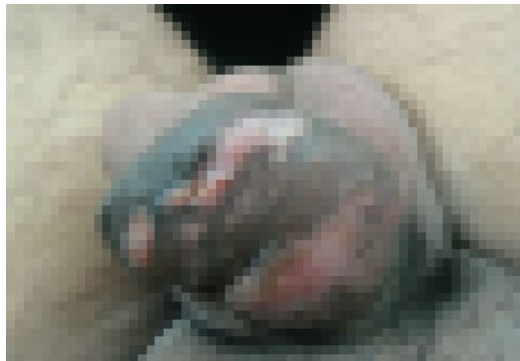
ภาพอวัยวะเพศที่ได้รับการฉีดสารแปลกปลอม ผิวหนังเป็นก้อนแข็ง คิงรั้ง และเป็นแผลเรื้อรัง

อวัยวะเพศที่ได้รับการฉีดสารแปลกปลอมมาแล้ว ไม่สามารถรักษาให้เหมือนเดิมได้ แต่รักษาให้ดีขึ้น แก้ปัญหา ก้อนแข็ง การคิงรั้งตลอดจนแผลเรื้อรังได้ โดยการตัดสารแปลกปลอมและผิวหนังของอวัยวะเพศที่ปกคลุมออก แล้วปิดแผลด้วยผิวหนังจากถุงอัมตะหรือปลูกผิวหนัง