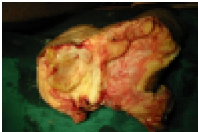
ผิวหนังของอวัยวะเพศที่ตัดออกมา (สังเกตเนื้อเยื่อแข็งผิดปกติสีขาวและวาสลินที่ไหลออกมา)