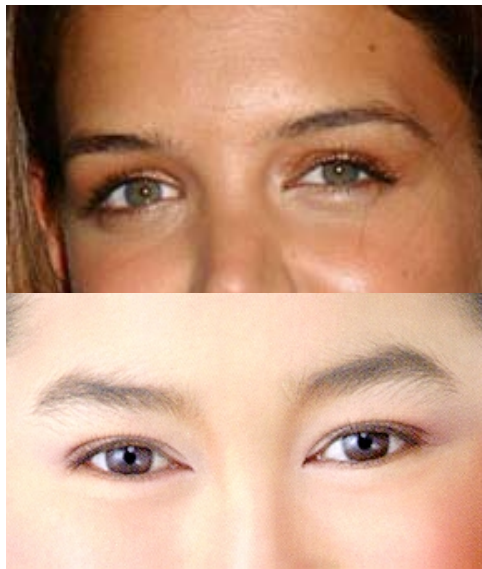
รูปที่ 1 เปลือกตาบนแบบชาวตะวันตกและชาวเอเชีย

ภาวะแทรกซ้อนจากการทำผ่าตัดตกแต่งเปลือกตาบน มีดังนี้คือ รอยชั้นตาไม่เท่ากัน, เปลือกตาววม การตกแต่งเปลือกตาล่าง ผลแทรกซ้อนที่จะมีได้คือ หนังตาล่างมีการดึงรั้งลงทำให้เห็นตางามากเกิน ภาวะนี้อาจจะพบได้ชั่วคราวประมาณ 1-2 เดือน, อาจจะมีภาวะเยื่อตาขาวบวม น้ำ, เลือดออกใต้ตาขาว ภาวะแทรกซ้อนเหล่านี้อาจจะหายได้เอง หรือหายได้หลังจากมีการผ่าตัดแก้ไข